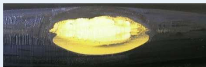
検知層(黄色)露出状態 (摩耗検知イメージ)